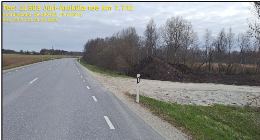
Väljavõtte teeinfo kaamera pildist, riigitee km 7,718 (29.04.2026)

Sama kirjaga oleme selgitanud, et Transpordiameti hinnangul on võimalik olemasolev ühendus viia vastavusse Transpordiameti nõuetega. Eeltoodust tulenevalt nõustume ristumiskoha seadustamisega riigitee ligikaudu km 7,73 asukohas ning uuendame ristumiskoha ehitamiseks esitatavaid nõudeid.